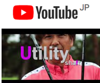
YouTube ワッグルチャンネル